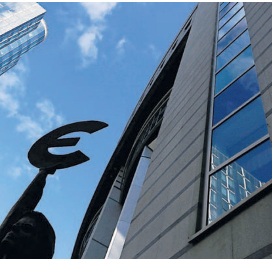
El símbolo de Europa en el exterior del Parlamento Europeo, en Bruselas.